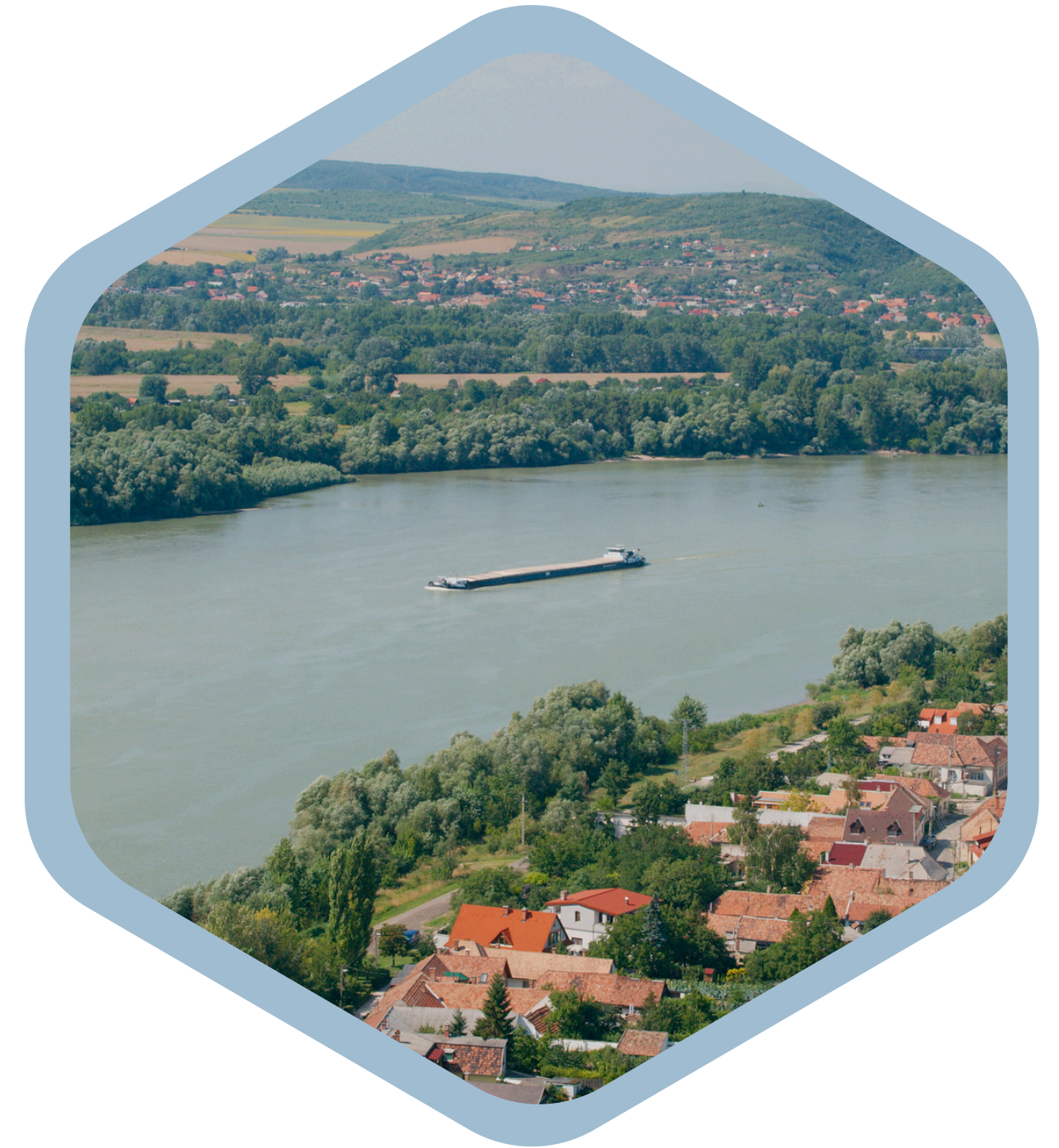
ACTIUNEA 4.2 ITI