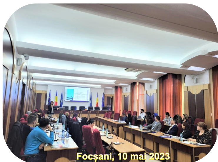
Focșani, 10 mai 2023

Metodologia privind abordarea principiului DNSH și imunizarea infrastructurii la schimbări climatice în cadrul Programului Regional Sud-Est 2021-2027 poate fi vizualizată accesând site-ul dedicat PRSE: regiosudest.ro