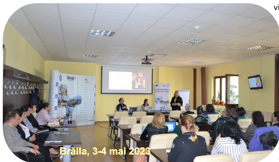
Brăila, 3-4 mai 2023

Noul Bauhaus European își propune să asigure o calitate mai bună a vieții, punând în prim-plan simplitatea, funcționalitatea și circularitatea materialelor, fără a compromite nevoia de confort din viața noastră cotidiană.