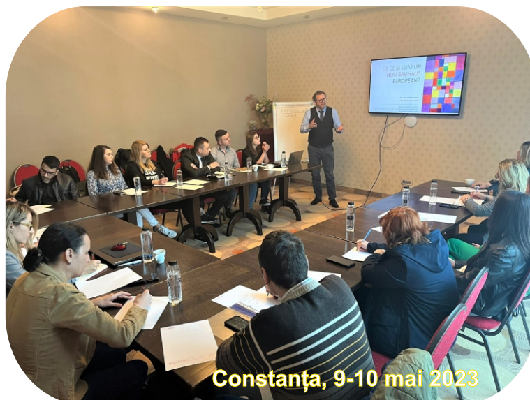
Constanța, 9-10 mai 2023