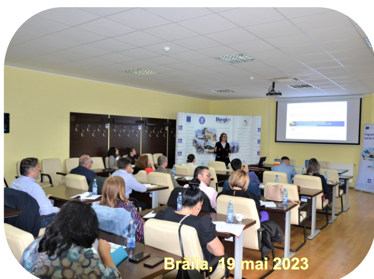
Brăila, 19 mai 2023