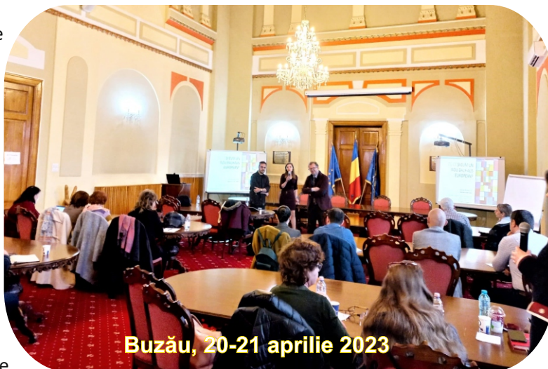
Buzău, 20-21 aprilie 2023

Noul Bauhaus european își propune să creeze un nou stil de viață care să îmbine sustenabilitatea cu un design bun, care să