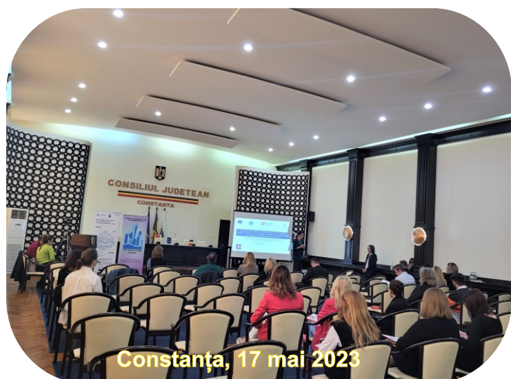
Constanța, 17 mai 2023