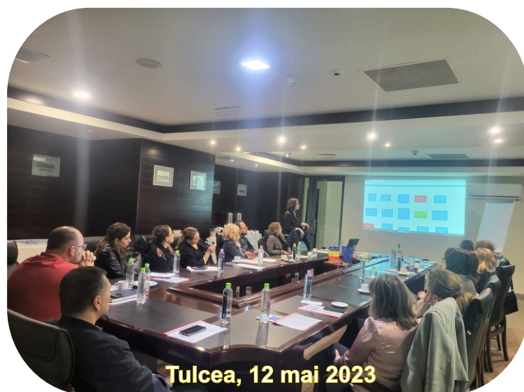
Tulcea, 12 mai 2023