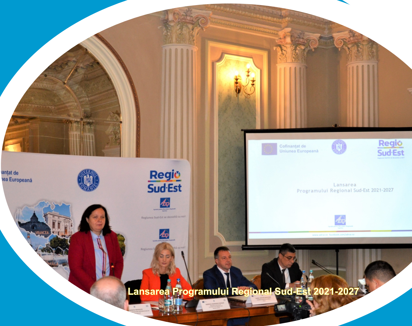
Lansarea Programului Regional Sud-Est 2021-2027